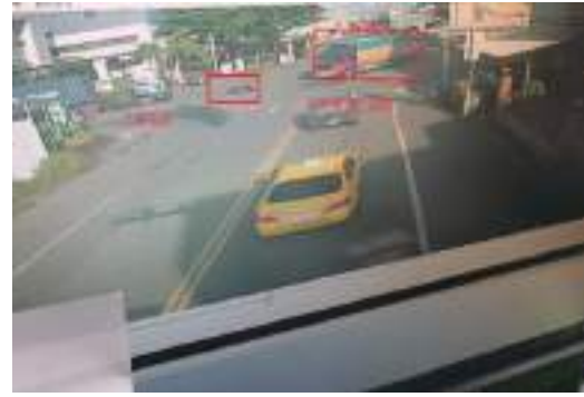
照片6：機車倒地與大車擦撞