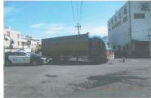
照片中之刮痕、油漬、機車、人員皆未標於警繪圖中