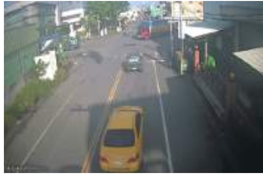
照片5：機車失控倒地