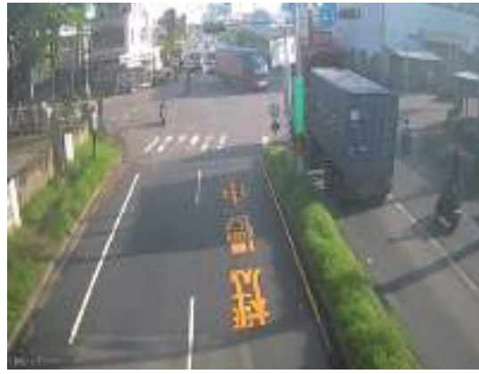
照片3：大車已左轉車頭，機車出現(一大車右後方) 狀況3：機車距路口停等線約15米